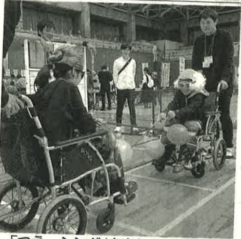
「つえーしんぐ」を楽しむ来場者ら

スポーツ体験や 福祉機器を展示 湯梨浜で介護フェア 「いきいき長寿の祭 典」とり介護フェア 2018」（鳥取県な ど主催）が、湯梨浜町 藤津のあやめ池スポー ツセンターであった。 誰でも気軽に楽しめる 「ゆるスポーツ」の体 験や福祉機器の展示な どがあり、来場者は介 護への理解を深めた。 11月11日が「介護の 日」に定められ10年に 当たることから、介護 職のイメージ向上を図 るつと企画。はわいこ ども園（同町光吉）の 園児のフラダンスで開 幕し、約450人が来 場した。