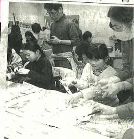
韓紙を使ってオリジナルしおりを と話し。 グルメブームも長蛇 の列。台湾のタピオカ ミルクティーや韓国の り巻き、インドカレー などが並び、子どもか ら大人まで、普段味わ うことのない各国の料 理に舌鼓を打った。 (池田悠平)

スポーツ体験や 福祉機器を展示 湯梨浜で介護フェア 「いきいき長寿の祭 典」とり介護フェア 2018」（鳥取県な ど主催）が、湯梨浜町 藤津のあやめ池スポー ツセンターであった。 誰でも気軽に楽しめる 「ゆるスポーツ」の体 験や福祉機器の展示な どがあり、来場者は介 護への理解を深めた。 11月11日が「介護の 日」に定められ10年に 当たることから、介護 職のイメージ向上を図 るつと企画。はわいこ ども園（同町光吉）の 園児のフラダンスで開 幕し、約450人が来 場した。